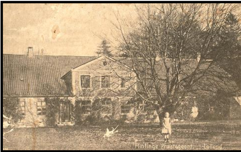
Fotograf: P. Pommer, Øster Thoreby Registreret af Jesper Smidt 17/10 1995.